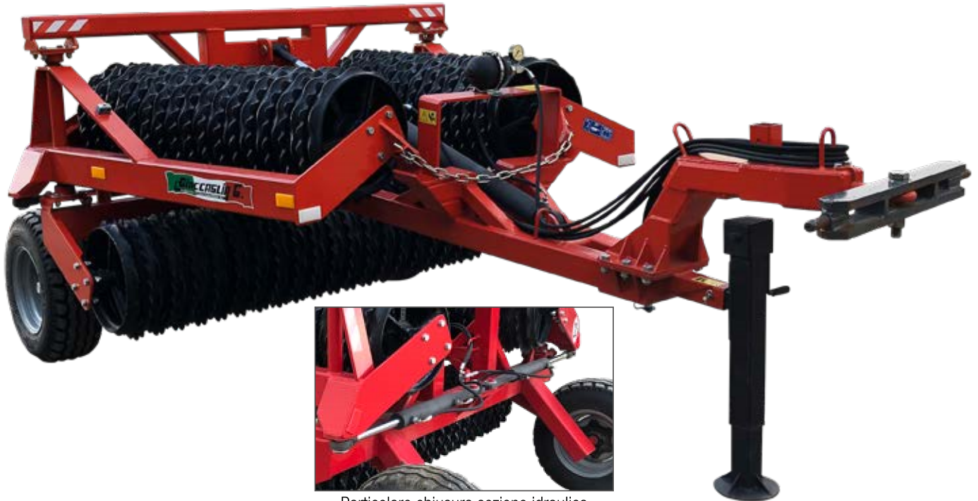
Particolare chiusura sezione idraulica Hydraulic system folding gang